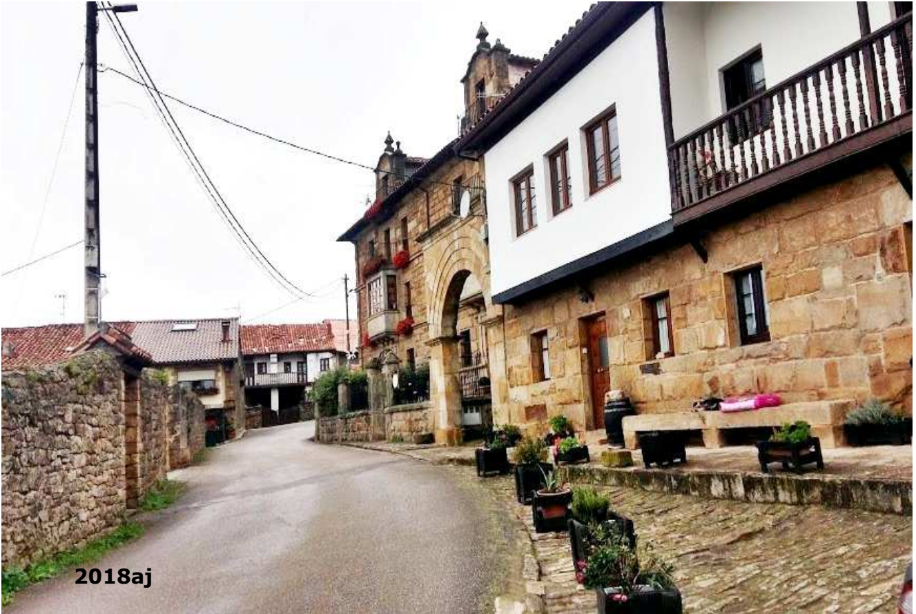
Entrada en el pueblo

Indicación desde Bostronizo a la Ermita de San Román de Moroso