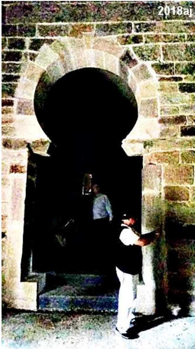
Vistas desde el interior