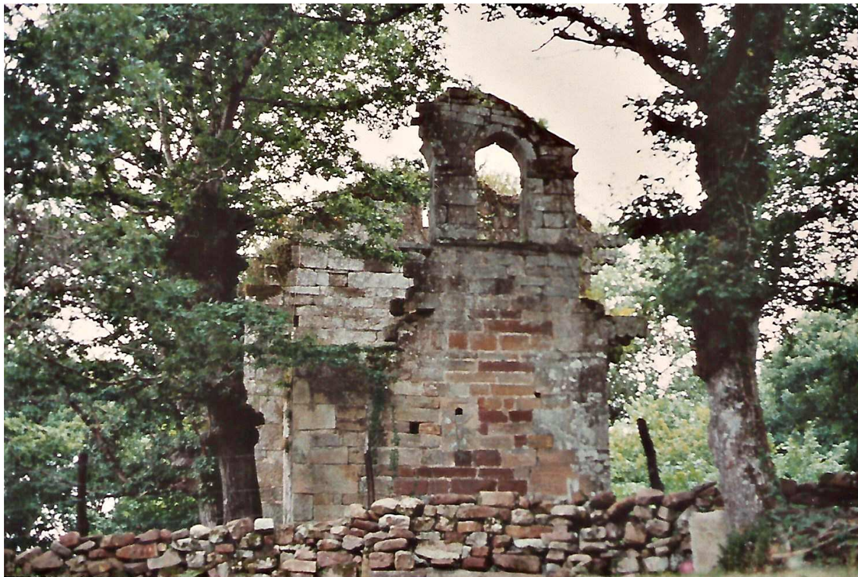
Situación antes de la restauración