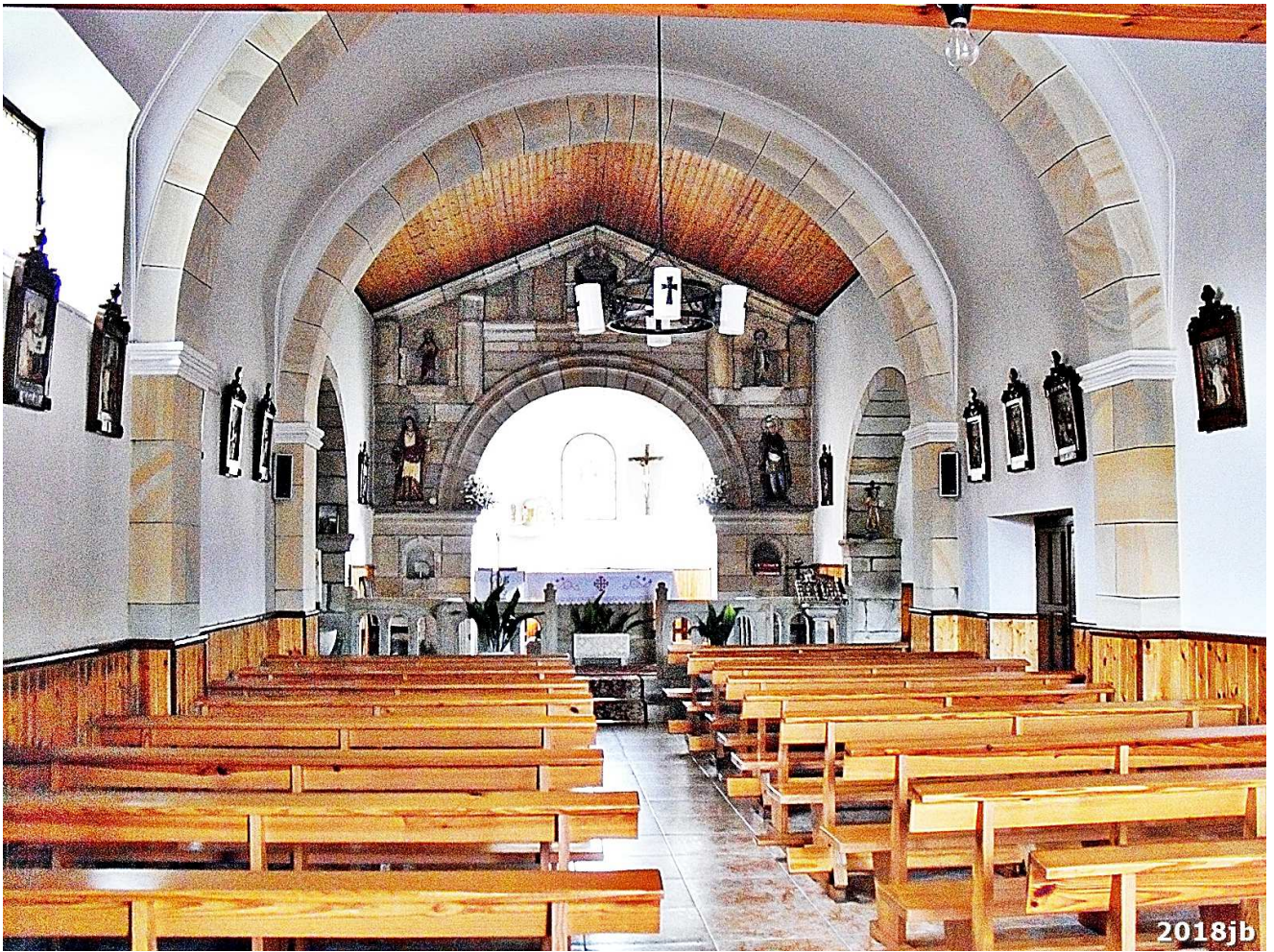
Vista actual del interior, desde la entrada.