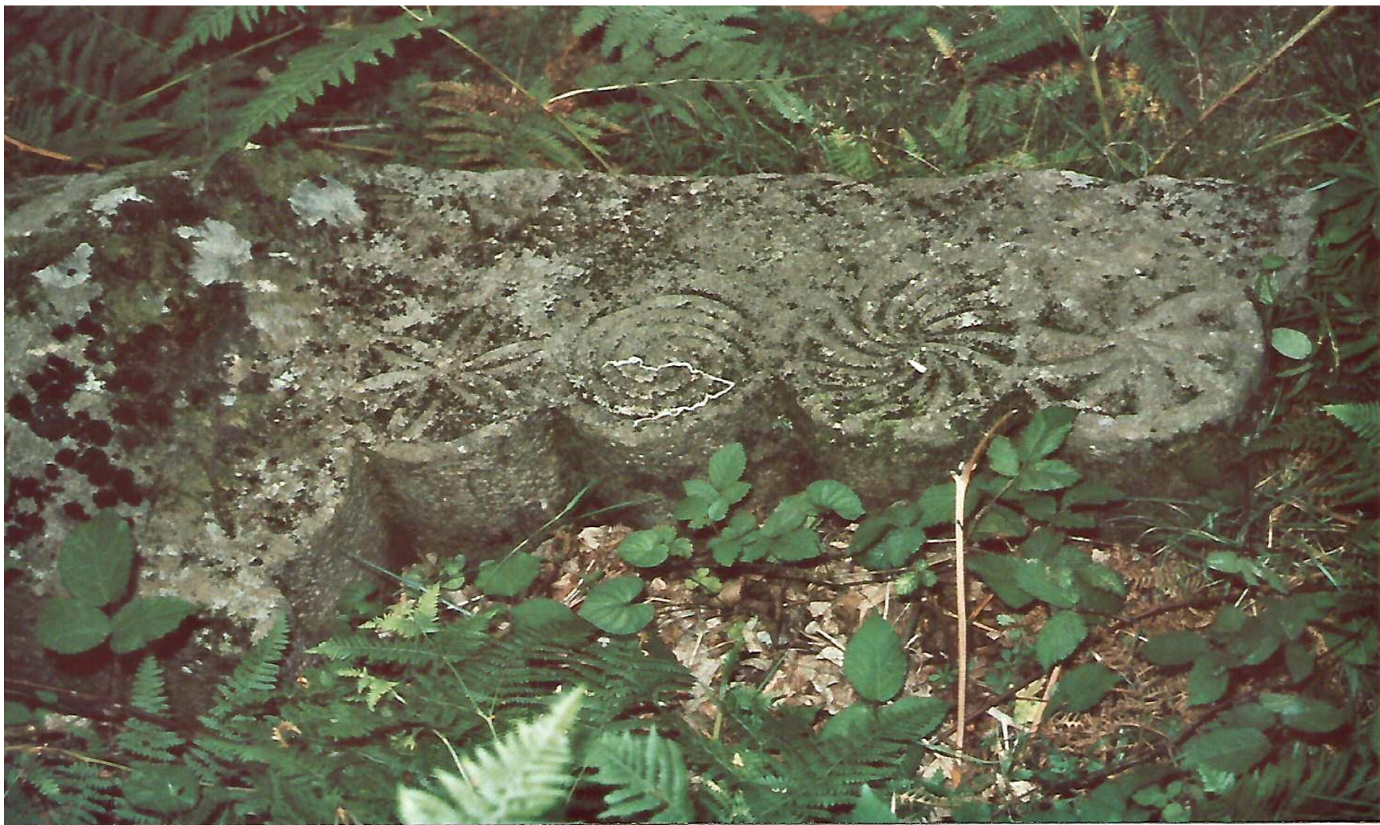
Situación antes de la restauración