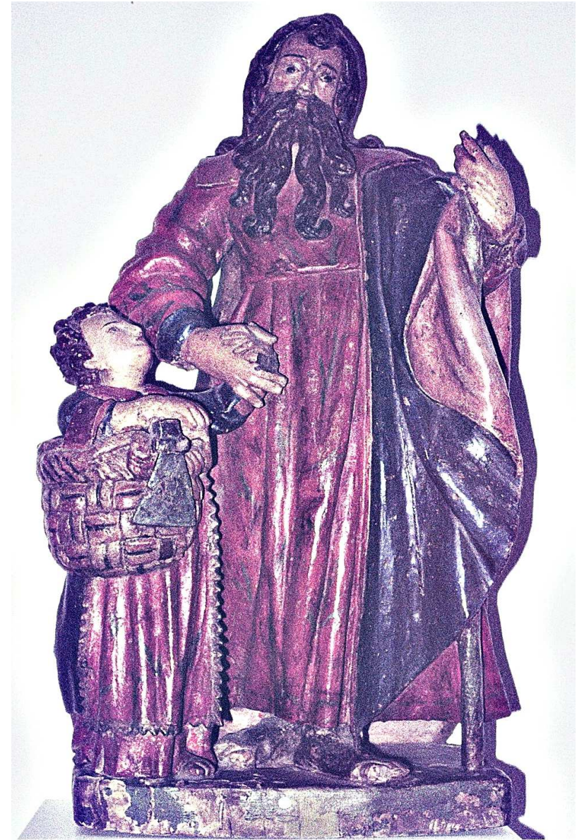
San José con el niño - Siglo XVII Bostronizo

Estatuas de la IGLESIA PARROQUIAL DE SANTA EULALIA (Bostronizo) depositadas en el Museo Diocesano Regina Coeli de Santillana del Mar (Cantabria)