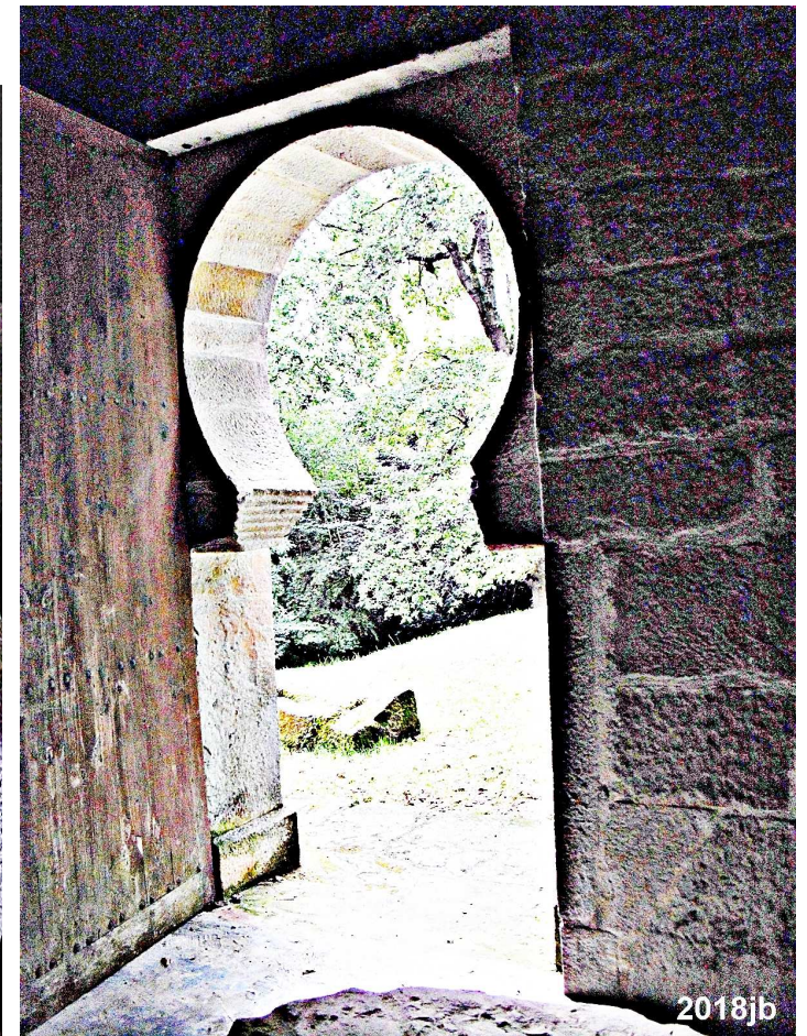
Vistas desde el interior