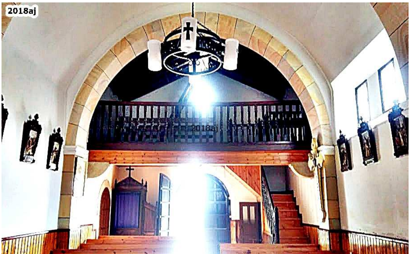
Vista de la entrada, desde el Altar Mayor.