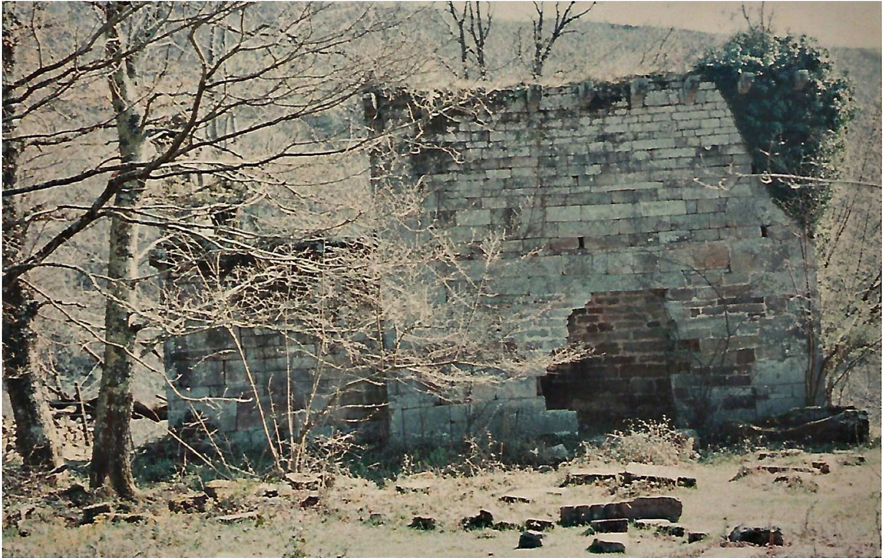
Situación antes de la restauración