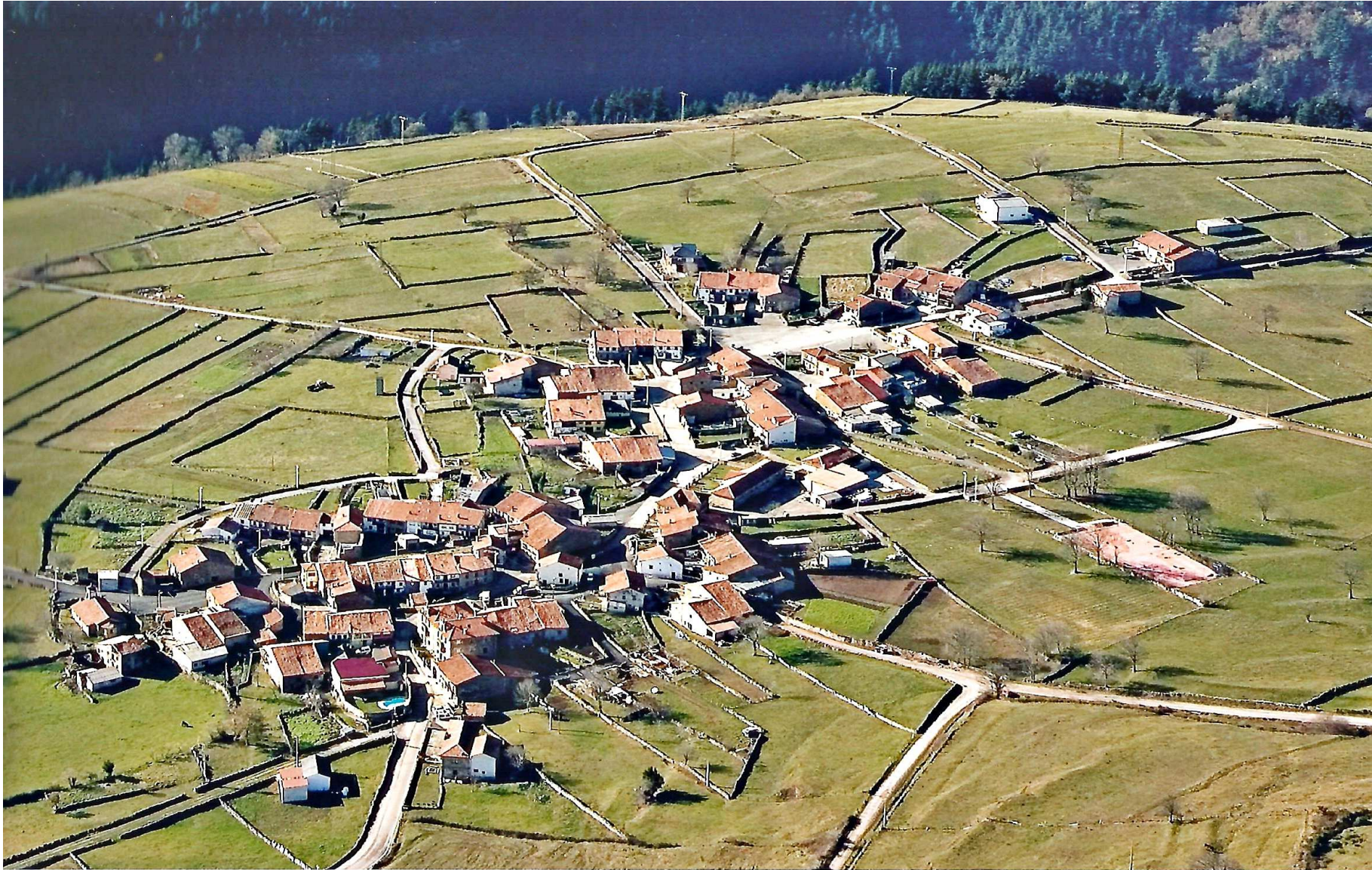
Casco urbano de Bostronizo. Vista aérea realizada en el año 1970