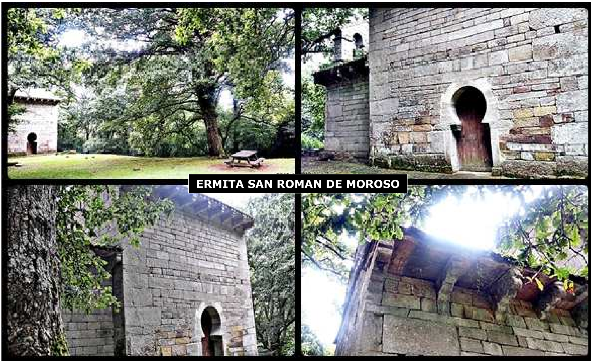
ERMITA SAN ROMAN DE MOROSO