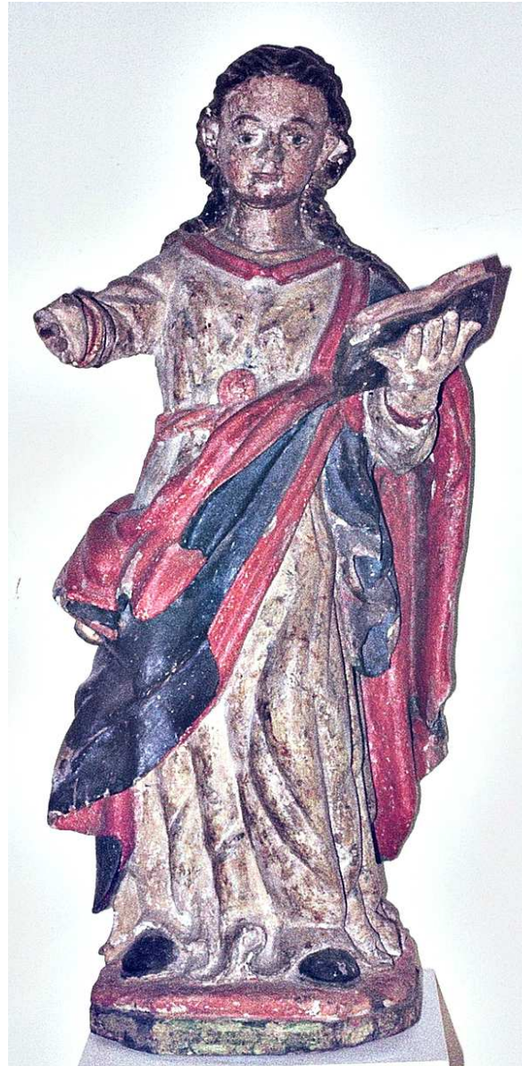
San Juan Evangelista Siglo XVII - Bostronizo