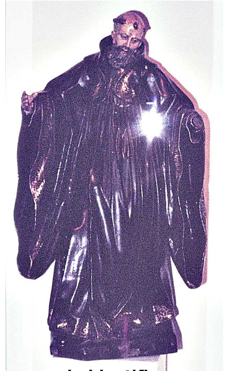
sin identificar Bostronizo