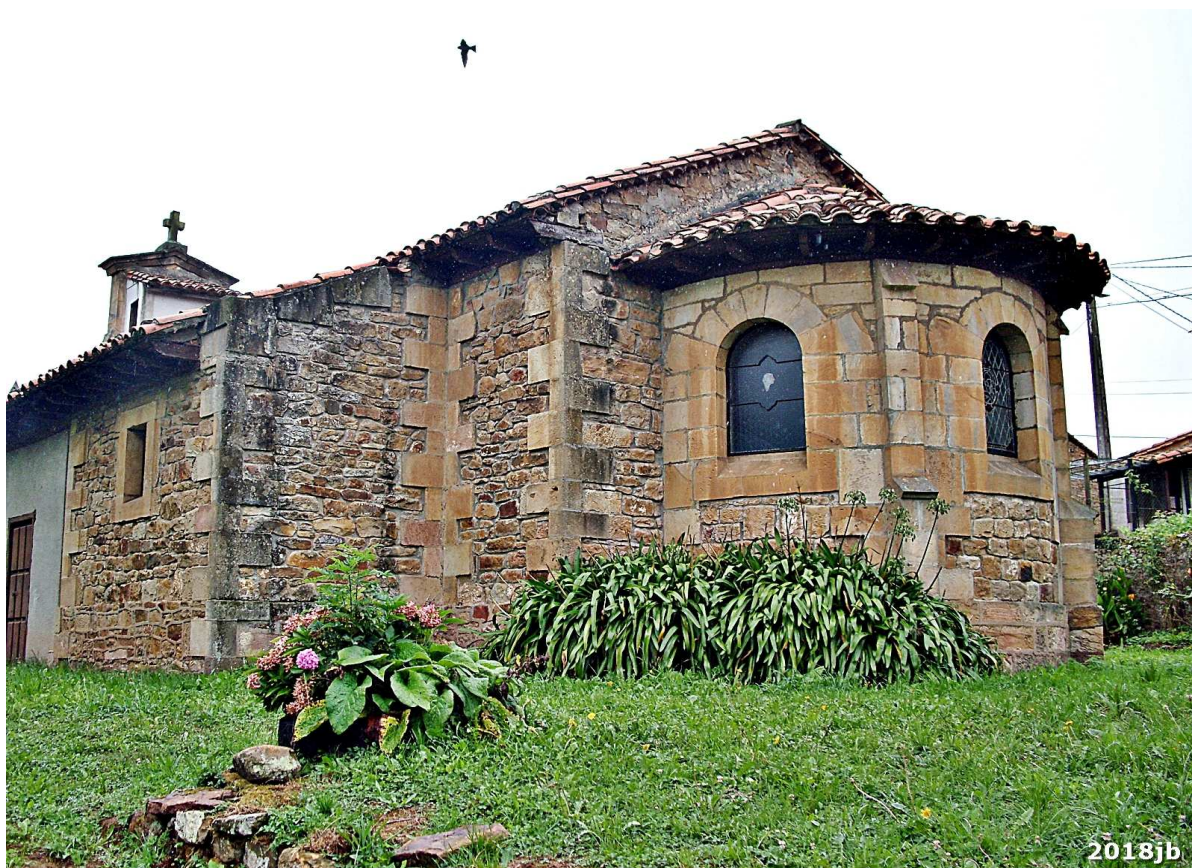
Vista posterior de la Iglesia con ábside de cantería y techo de teja y madera