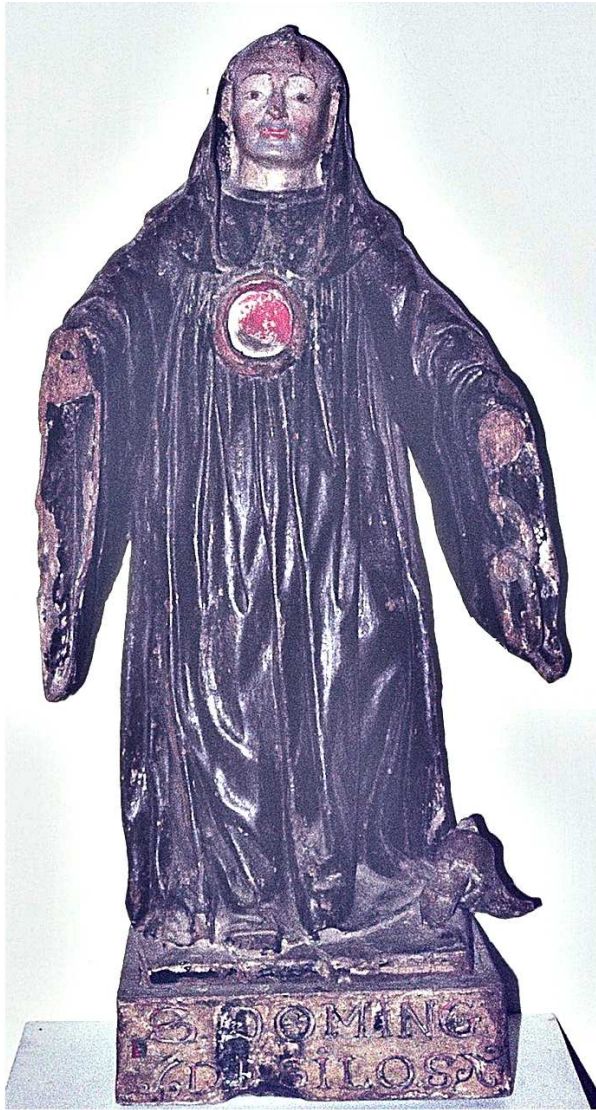
Santo Domingo de Silos Siglo XVII, con agujero donde previsiblemente se situaban las reliquias - Bostronizo