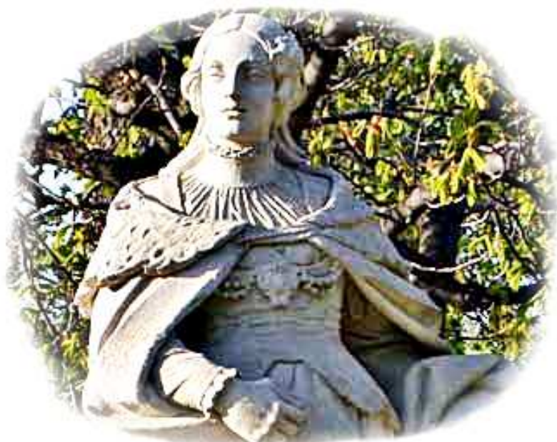
D a URRACA I Reina de Castilla y León