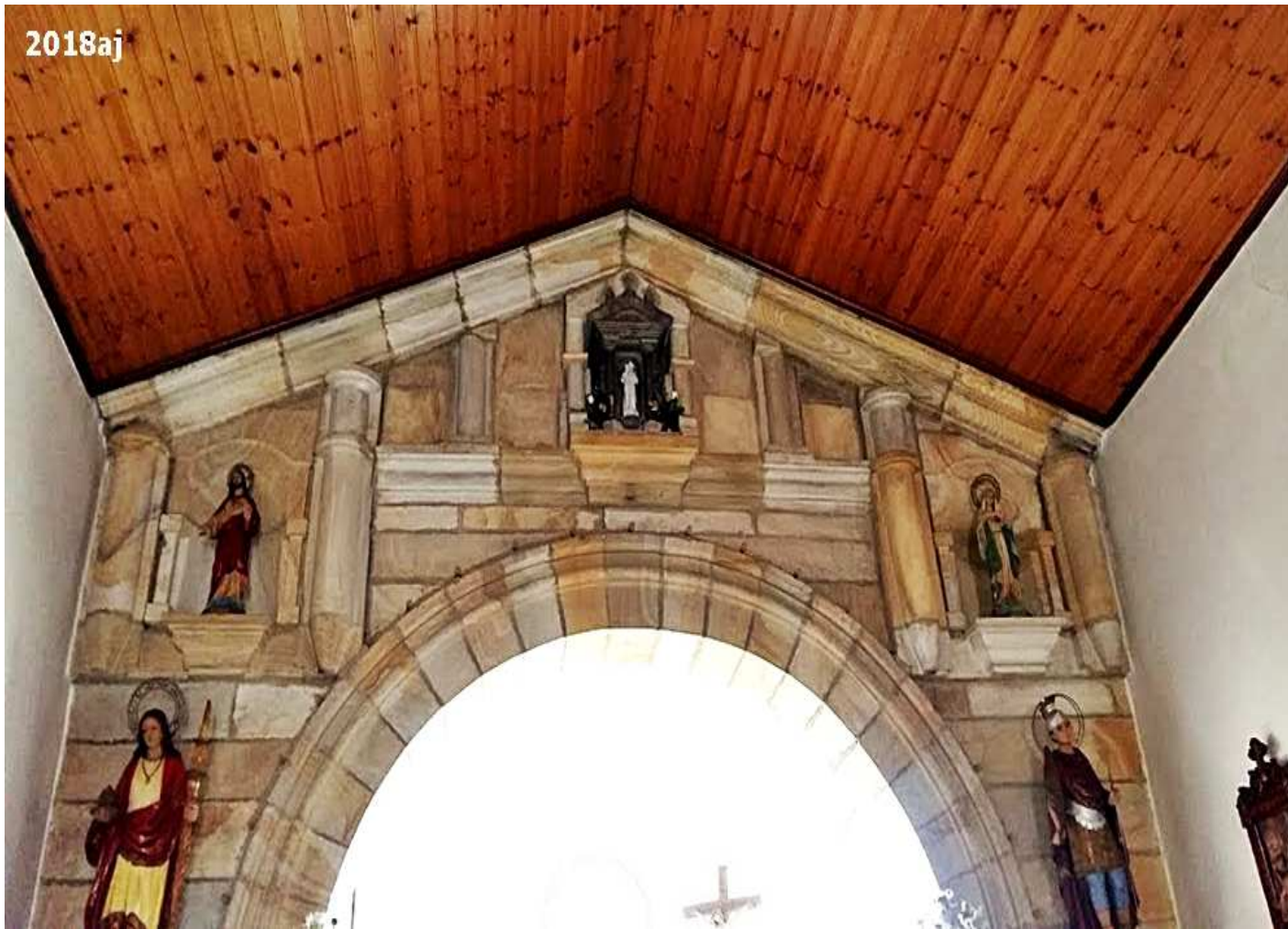
Vista del retablo en piedra donde se encuentran las estatuas de los patronos del pueblo: Santa Eulalia y San Román