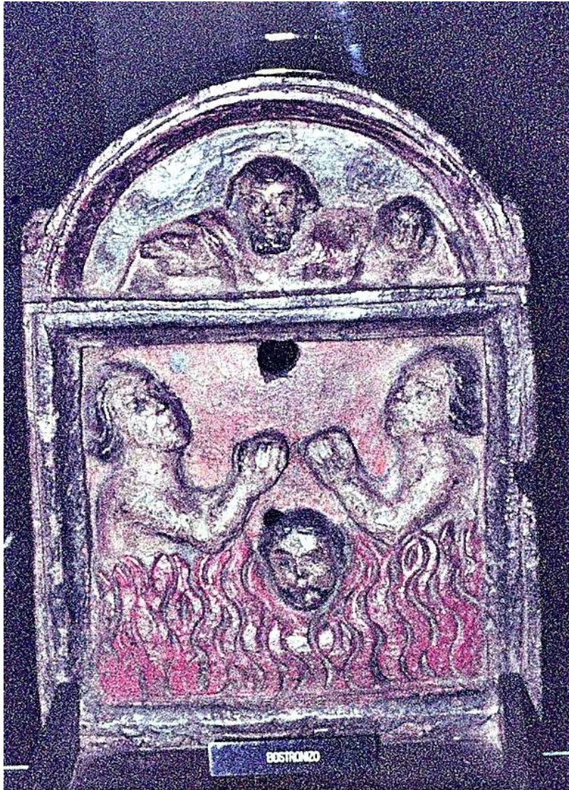
Cepillo de pedir limosna para las ánimas benditas del purgatorio - Bostronizo

Estatuas de la IGLESIA PARROQUIAL DE SANTA EULALIA (Bostronizo) depositadas en el Museo Diocesano Regina Coeli de Santillana del Mar (Cantabria)