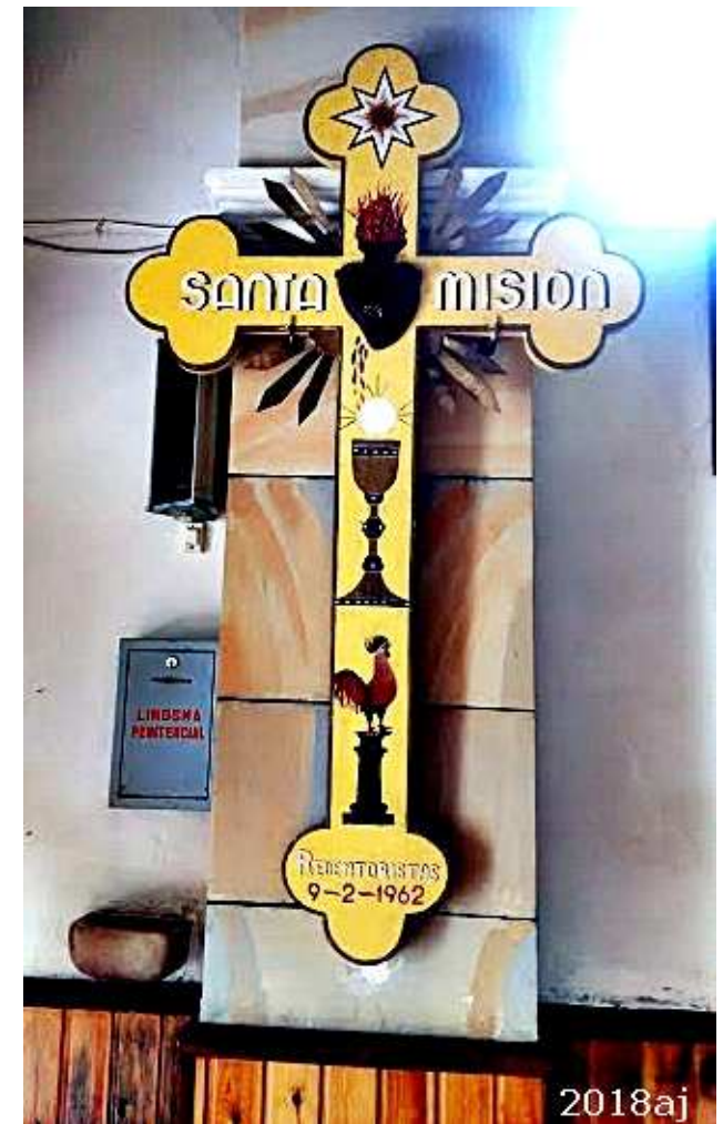
Recuerdo de la última Santa Misión (02-1962)